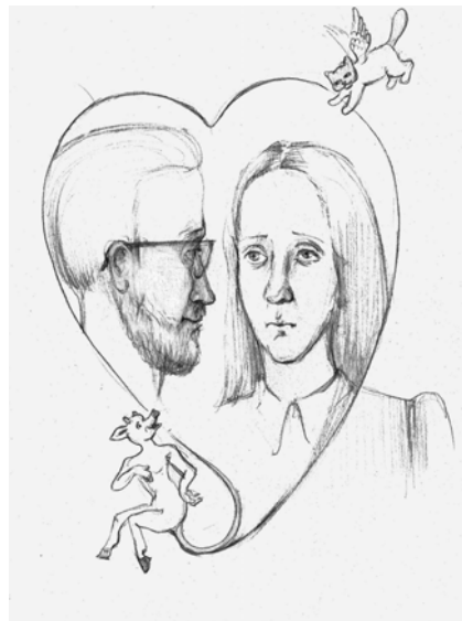
Ilustraĵo de Tatjana Ĥomjakova

piedoj. Nun ŝi eksentis lian manon ankaŭ sur sia genuo.